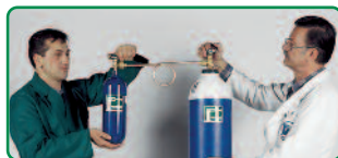
Refill oxygen cylinders at the operator's own premises by means of the PERKEO refilling loop

The newly developed design of the 200 bar oxygen cylinder contains 1 l volume/0.2m 3 oxygen and can be refilled by the operator at their premises by means of the corresponding PERKEO refilling adapter. The 600 ml power gas cartridge with special gas mixture is a disposable cartridge that can be easily changed by hand. With the MINI ECO you are independent of gas suppliers. That means cost and time savings and thus more efficient working process every time with PERKEO's popular equipment.